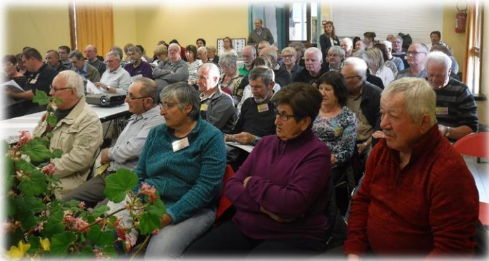
Montselgues le 16 mars

Comme chaque année en début de printemps, se déroulent les premières réunions avec nos Correspondants. Cette année, ce sont les villages de Montselgues, Chanéac et Sarras qui nous ont accueillis et ont pu faire découvrir leur contrée.