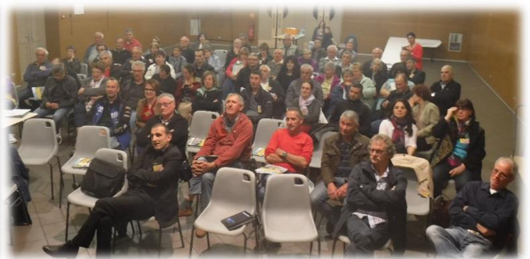
Sarras le 21 mars