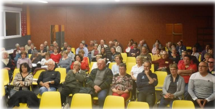
Chanéac le 17 mars